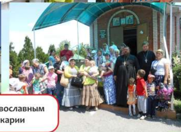
Паломническая поездка к православным святыням Кабардино-Балкарии