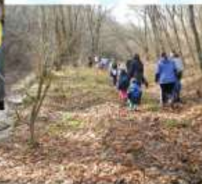
Поход участников семейного клуба