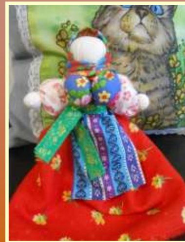
Юлия Принц (Союзащита)