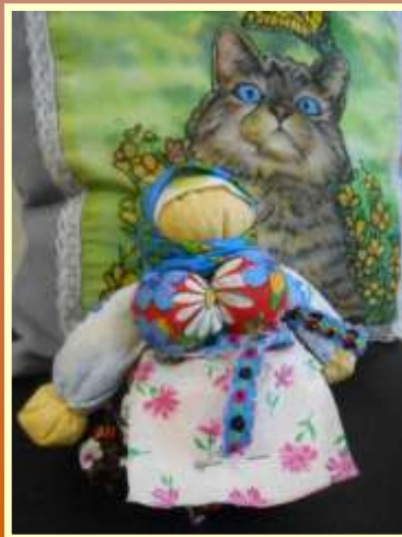
Галина Фомина (Союзащита)