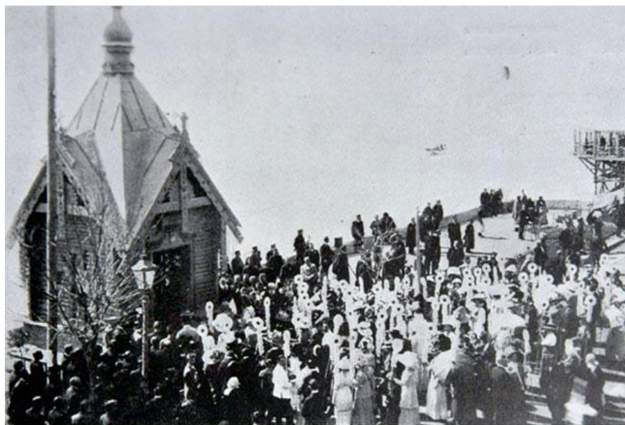
Ялта. Молебен у часовни на набережной в день «блага цветка».