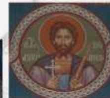
Храм иконы Божией Матери "Скоропослушница" на Ходянской поляе