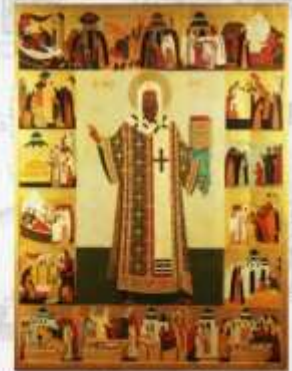
Храм Рождества Христова в Митине: