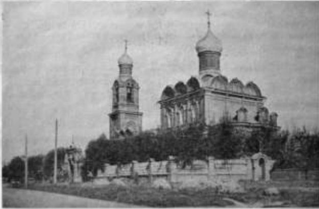
Храм Преображения Господня в Тушине.