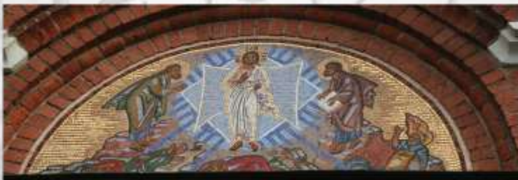
Храм Преображения Господня в Тушине