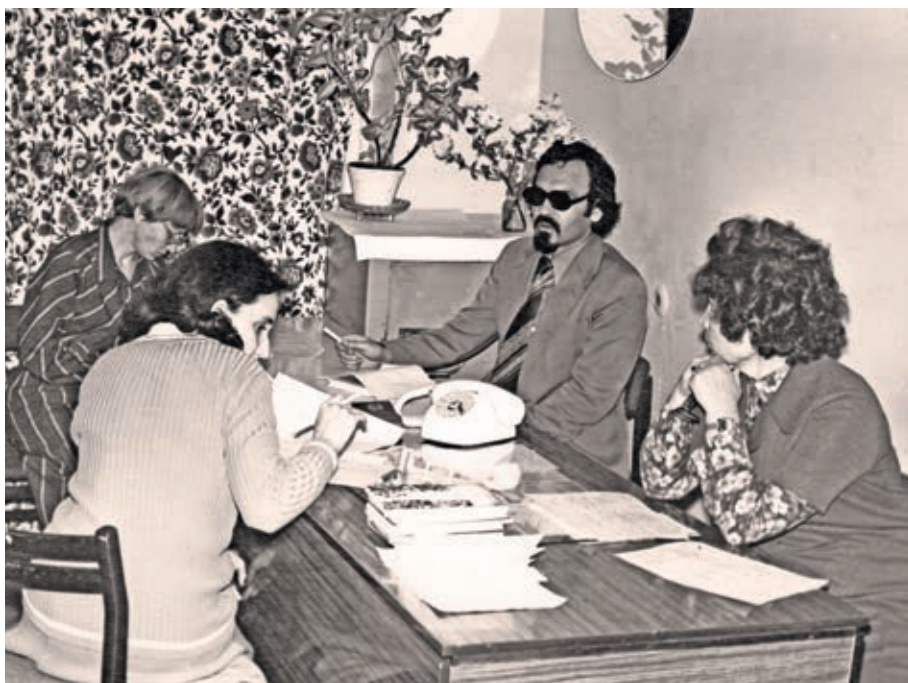
В редакции газеты «Ставропольская правда», 1980 г.