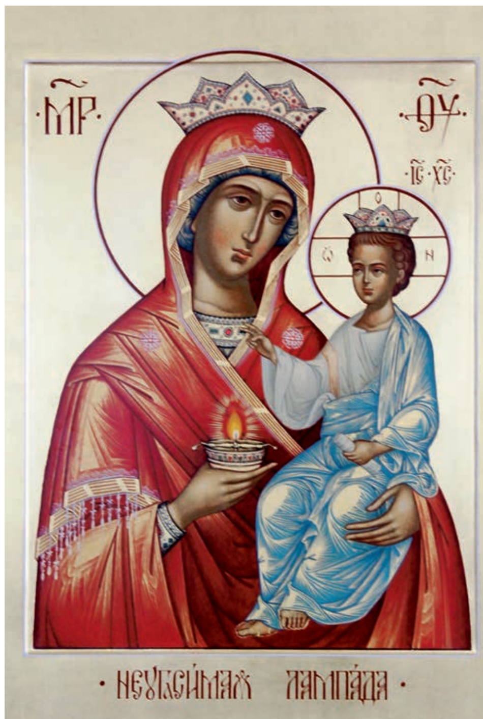
Икона «Неугасимая лампада». Иконография Иоанна Рутенина, 2014 г.