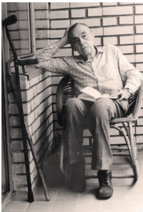
А. А. Тарковский в Матвеевском.