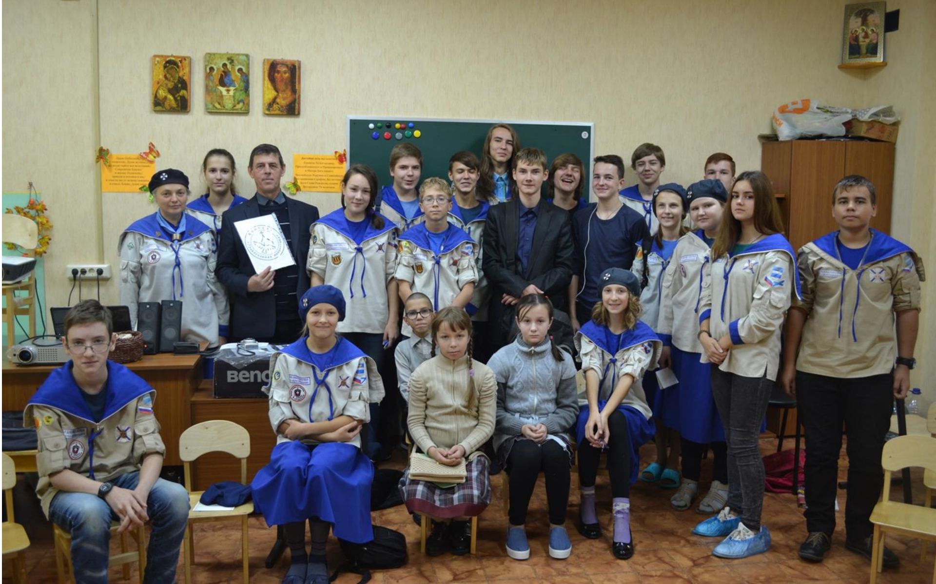
На занятии с воспитанниками воскресной школы при храме Покрова Богородицы на рву г. Калуги