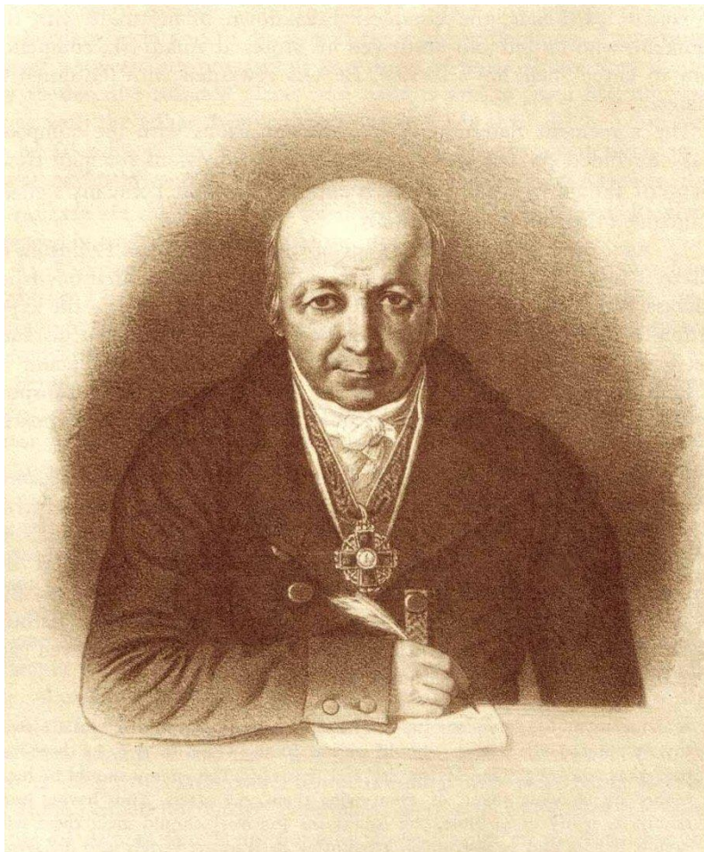
Александр Андреевич Баранов, первый главный правитель Русской Аляски (1746-1819)