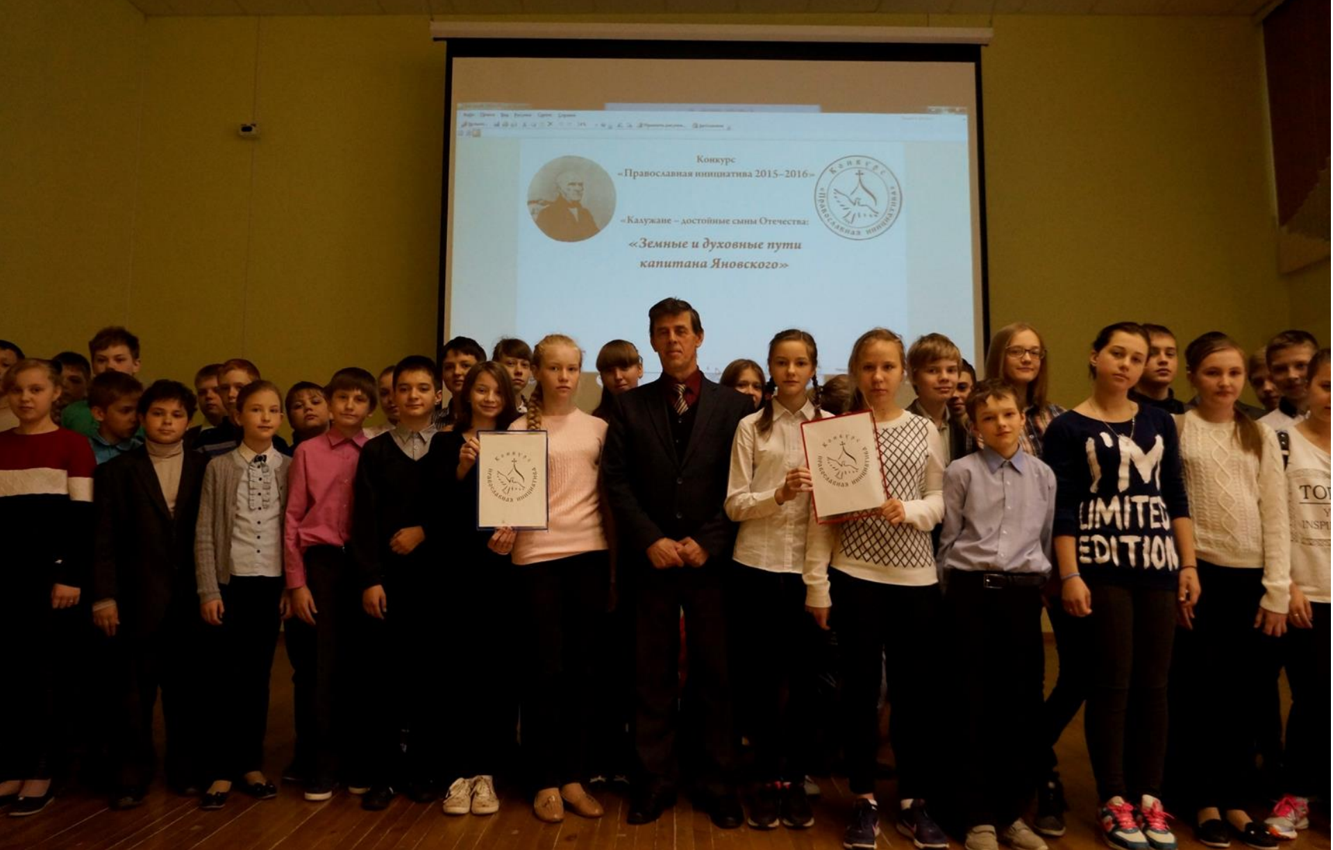
На занятии с учащимися лицея № 48 г. Калуги