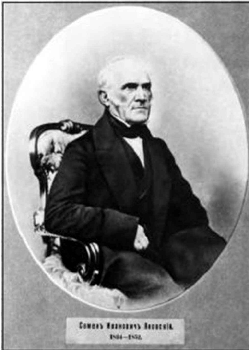
Семенъ Ивановичъ Яновскій. 1789—1876.