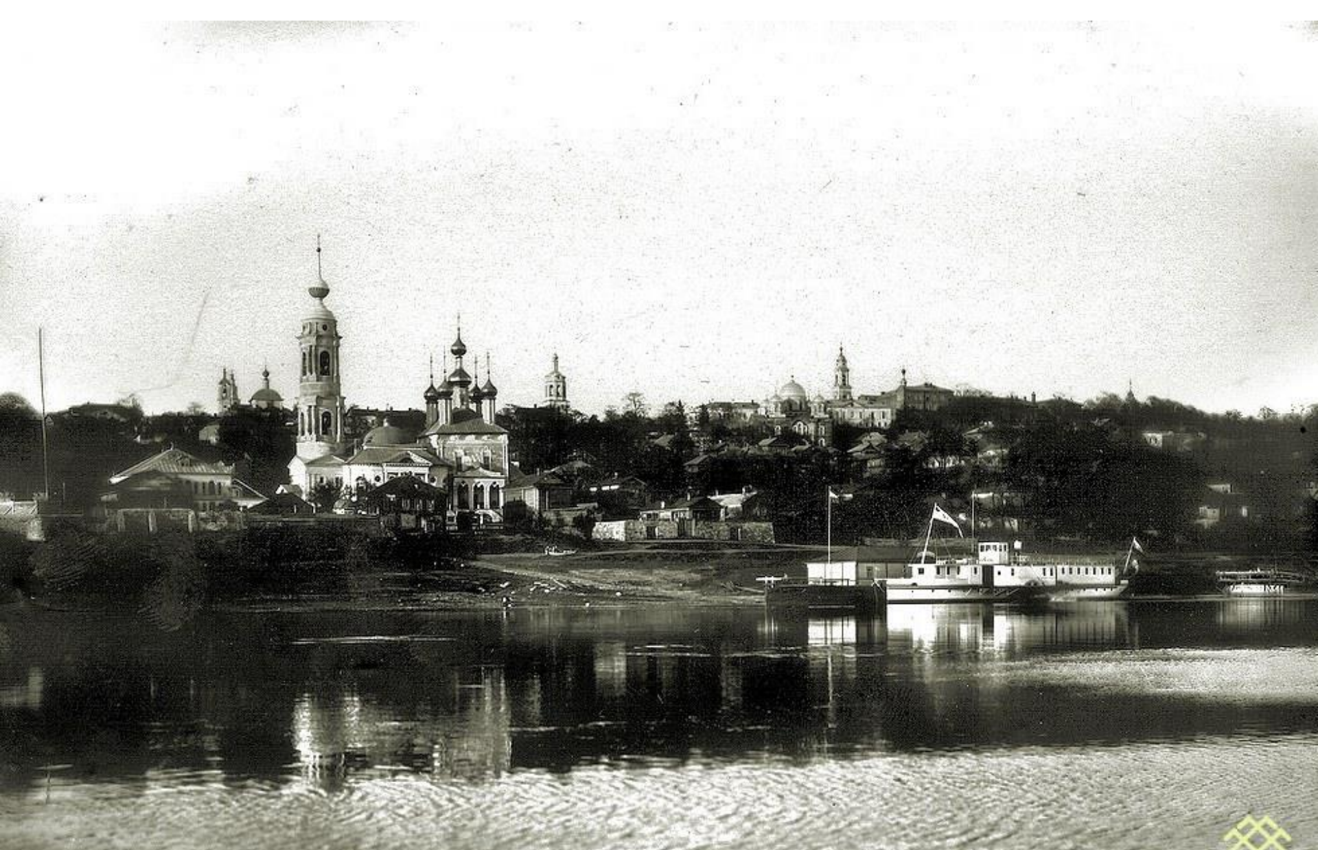
Калуга XIX века. Вид с правого берега р. Оки