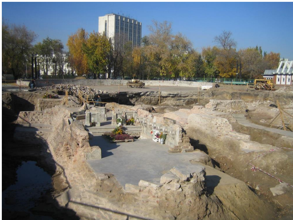
Раскопки Свято-Успенского кафедрального собора. 2005 год. Часть нижнего придела храма, сохранившаяся после взрыва вокруг тайного захоронения священномученика Сильвестра Омского, ныне встроенная в здание восстановленного собора

13. Полещук, Н.В. Господь явил нам мощи своего угодника. Интервью с митрополитом Омским и Тарским Феодосием // Омские епархиальные ведомости. – 2005. – № 8.